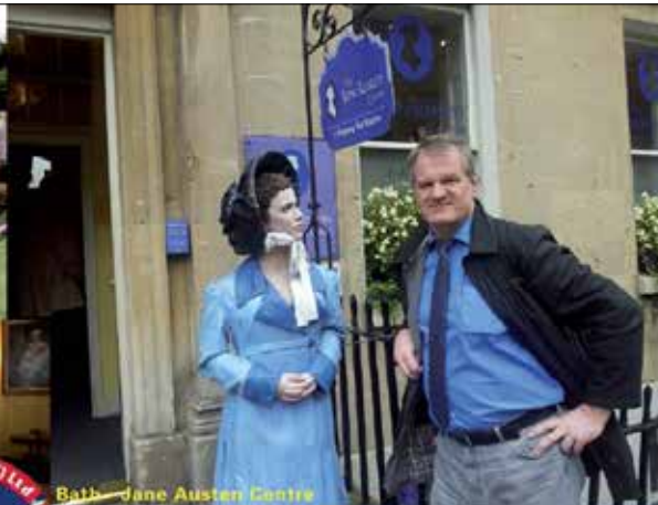
Bath - Jane Austen Centre