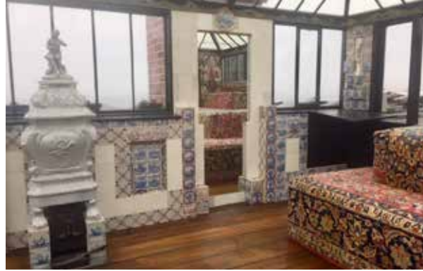
Victor Hugo House – Guernsey