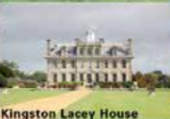
Kingston Lacey House