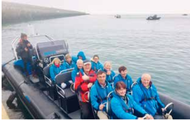
Rib Trip: Jersey –Écréhous