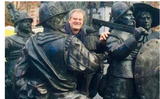
Rembrandt Platz – Amsterdam