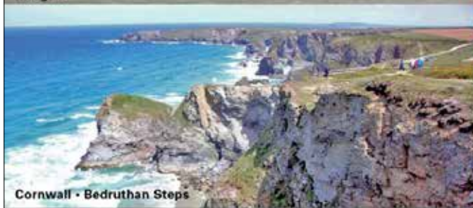
Cornwall - Bedruthan Steps