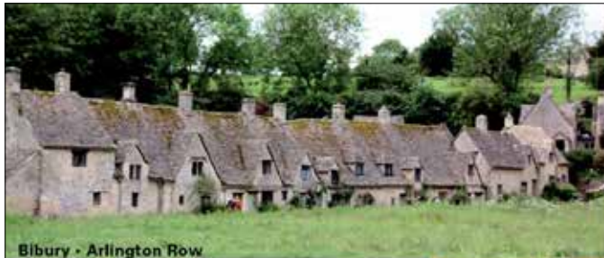
Bibury - Arlington Row